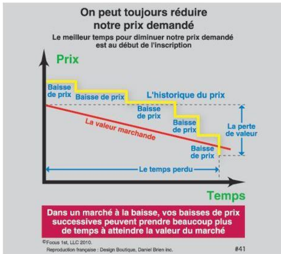
Tableau No 3

Plus le vendeur attend avant de faire cet exercice plus le prix demandé sera plus bas que le prix qu'il aura déterminé au départ, lors de son inscription parce que la valeur marchande d'un marché d'acheteurs, diminue constamment.