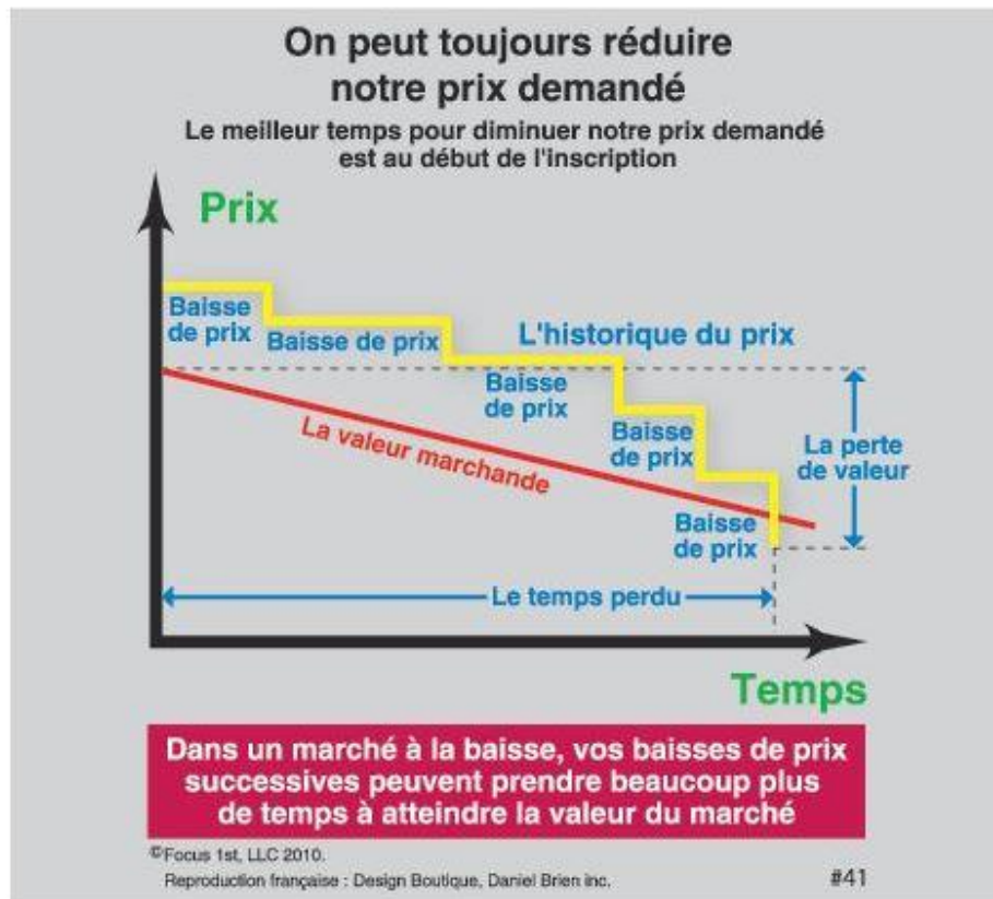
Tableau No 3

Plus le vendeur attend avant de faire cet exercice plus le prix demandé sera plus bas que le prix qu'il aura déterminé au départ, lors de son inscription parce que la valeur marchande d'un marché d'acheteurs, diminue constamment.