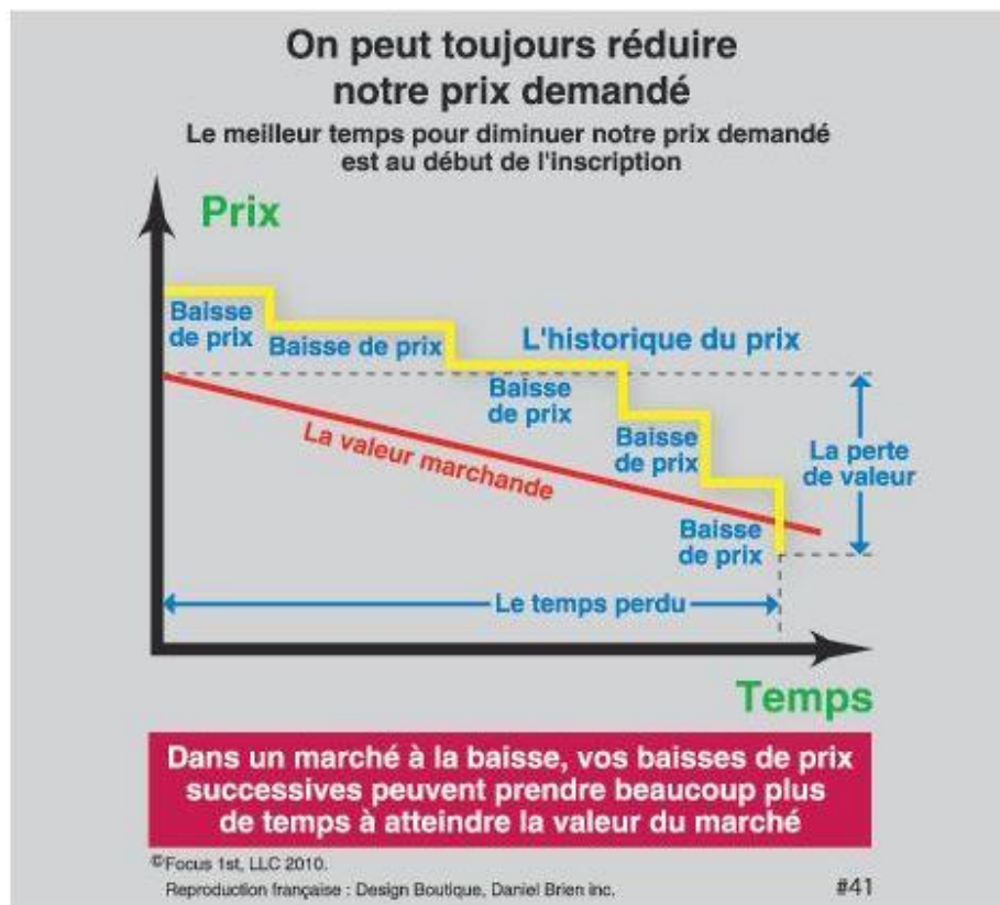
Tableau No 3

Plus le vendeur attend avant de faire cet exercice plus le prix demandé sera plus bas que le prix qu'il aura déterminé au départ, lors de son inscription parce que la valeur marchande d'un marché d'acheteurs, diminue constamment.