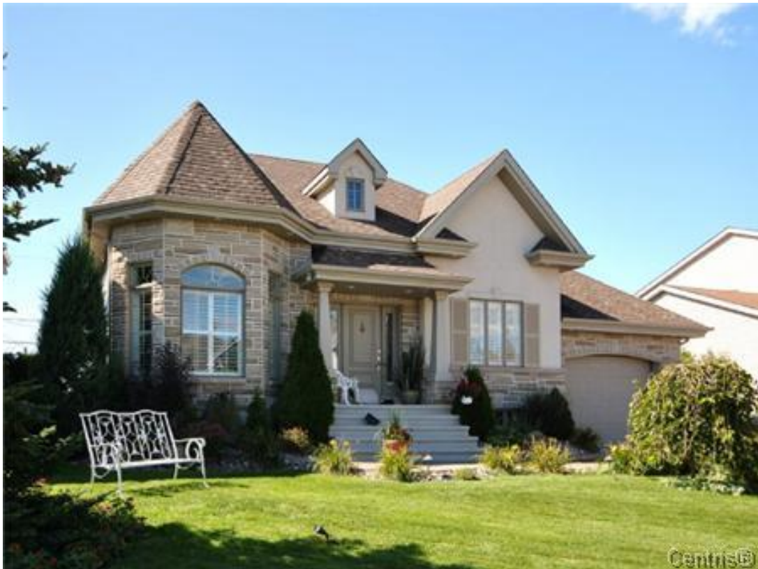
Maison Plain-Pied – "Bungalow"

Ce document traite du marché des maisons plain-pied (PP) "Bungalows".