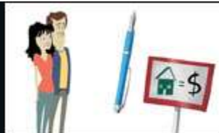
Offre d'achat et avant-contrat