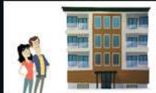
Condo (copropriété divise)