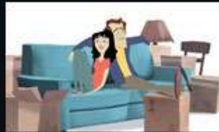
Achat et vente (copropriété indivise)